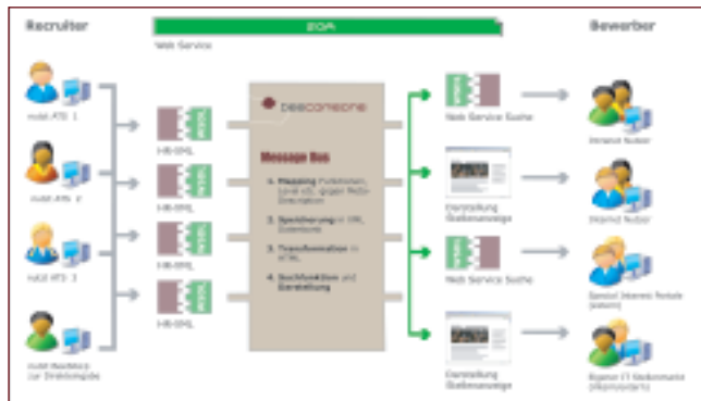
Aggregation von Input und Harmonisierung von Output

Wir stellen sowohl bei der Akzeptanz der Karriereseite, als auch bei der Quantität und Qualität der eingehenden Bewerbungen eine signifikante Verbesserung fest.