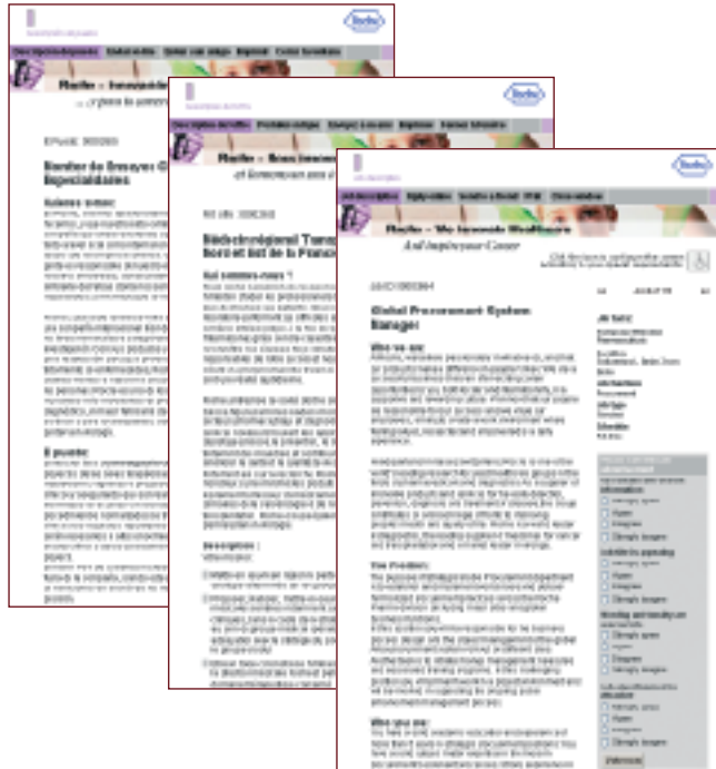
Einheitliche Umsetzung der Roche Employer Brand auf den Karrierewebsites verschiedener Länder

Die SOA-Lösung (Service-Orientierte-Architektur) BeeComeOne® übernimmt das Mapping und die Speicherung von Daten aus verschiedenen Systemen. Mittels Webservices und Transformationsvorgängen erfolgt eine einheitliche Darstellung der Daten in unterschiedlichen Kanälen. Die Software ist HR-XML zertifiziert und nutzt den HR-XML Standard SEP 2.2 zum Austausch HR-relevanter Daten.