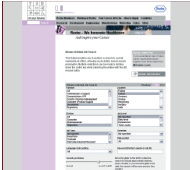
Stellensuche bei Roche mit Matching-Engine ELISE®: bessere Ergebnisse durch Gewichtung der Kriterien

Weitere im Rahmen des Projekts eingesetzte Produkte von milch & zucker: BeeSite® HR CMS zur Darstellung der Karrierewebsites in den verschiedenen Ländern in einem einheitlichen Look-and-Feel und Einhaltung der Employer Brand weltweit.