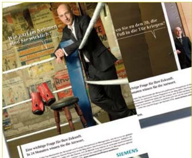
Vom ersten Entwurf zur fertigen Anzeige, mit Foto-Shooting und Übertragung auf die verschiedenen Maßnahmen.