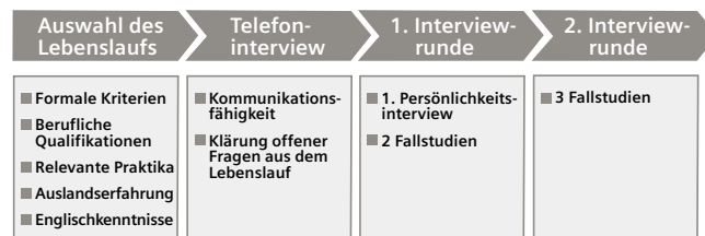
Auswahlprozess in vier Stufen

„Diese Chance erhalten nur die Besten nach einem harten Auswahlprozess. Daher brauchen wir von vorn herein hoch qualifizierte Bewerbungen auf das Programm. Nicht die Masse, sondern gut geeignete Kandidaten sollen sich angesprochen fühlen.“